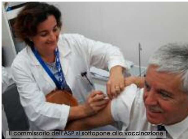
Il commissario dell'ASP si sottopone alla vaccinazione

L'Asp, Azienda sanitaria provinciale di Trapani, aderisce all'"Influ Day" giornata destinata alla promozione delle vaccinazioni, in detta lo scorso 6 dicembre dal Servizio Igiene pubblica del dipartimento regionale per le Attività sanitarie dell'assessorato regionale alla Salute. L'iniziativa, ha come scopo il veicolo di informazioni e la sensibilizzazione della cittadinanza sul delicato e controverso tema delle vaccinazioni. La Campagna si svolgerà nel corso della mattinata di oggi, a partire dalle 9.30 fino alle 12.30. Ad aderire all'iniziativa sono gli ambulatori vaccinali distrettuali di Alcamo, Castelvetrano, Marsala, Mazara del Vallo e alla Cittadella della salute di Erice Valle. Più nello specifico, nelle hall degli ospedali della provincia, saranno aperti dei punti di vaccinazioni. Il servizio Epidemiologia e medicina pre-