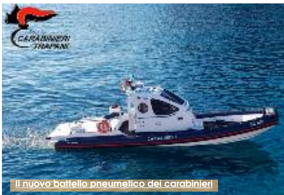
Il nuovo battello pneumatico dei carabinieri

I carabinieri di Favignana hanno in dotazione un nuovo mezzo nautico con il quale operare nelle tre isole Egadi. Si tratta del nuovissimo battello pneumatico d'altura cl. 400. Una imbarcazione all'avanguardia, dotata di strumentazione di bordo di ultima generazione vocata per le operazioni di controllo e salvaguardia dell'ambiente marino, ma anche per gli interventi di soccorso in mare o trasferimenti urgenti e necessari dalle isole alla terraferma. Per quanto riguarda questi ultimi due aspetti in particolare, il battello è in grado, infatti, di navigare con condizioni di mare severe e raggiungere velocità notevoli. Per la ricerca in mare fra la moderna strumentazione di bordo, in grado di dare in ogni istante la completezza dei dati sia sulla